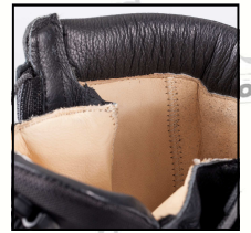
Doublure cuir beige

TIGE Cuir fleur noir 2,2 ± 0,2mm, Ignifugé et traité hydrofuge.